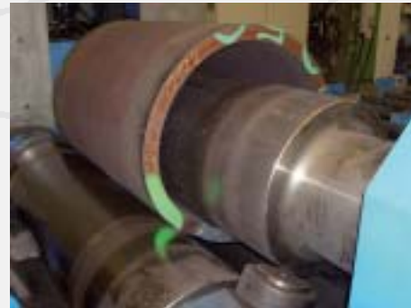
Re-rolling phase Fase di ricilindratura