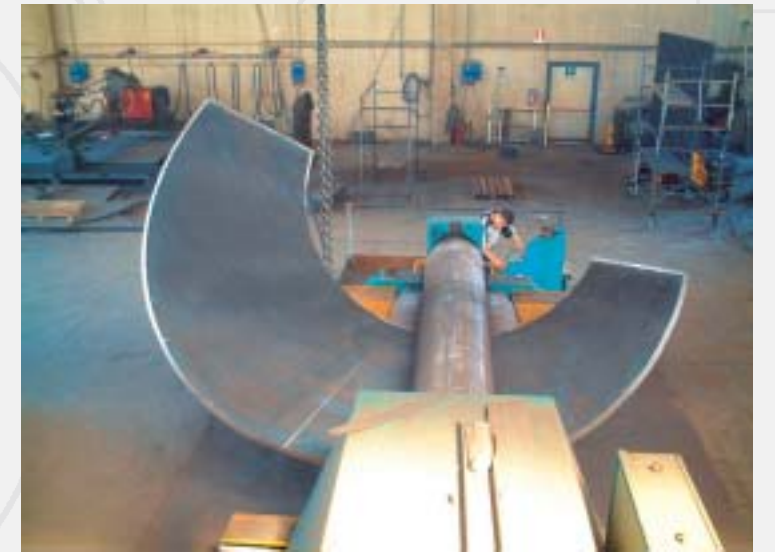
Asymmetric cone bending Calandratura cono asimmetrico