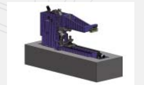
Flanging machine Bordatrice