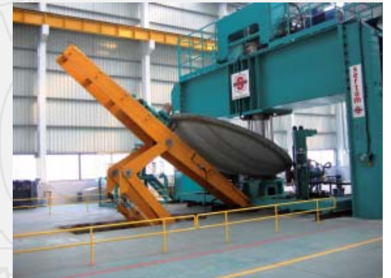
Hydraulic press and manipulator Pressa idraulica e manipolatore

È un equipaggiamento idraulico con movimenti traslatori e rotatori. Il manipolatore è un elemento ausiliario ed è asservito alla pressa dal basso. Il manipolatore è sincronizzato con il pistone della pressa. Questi movimenti possono essere simultanei o singoli e la loro logica sequenza determina un ciclo per l'esecuzione di fondi per serbatoi, ricavati da dischi di lamiera. Tutti i dispositivi di controllo sono centralizzati nello stesso pannello della pressa.