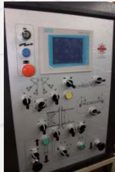
Control panel Pannello di controllo